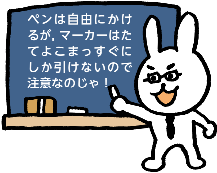
ペン・マーカーパレット